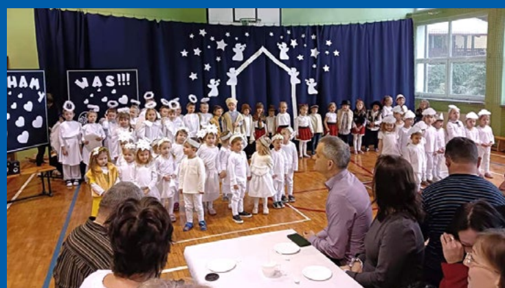
Dzień Babci i Dziadka w przedszkolu