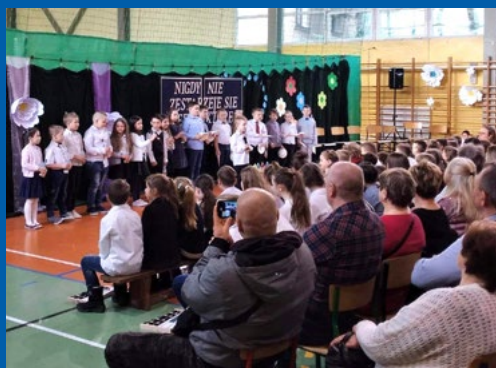
Dzień Babci i Dziadka klasa 1