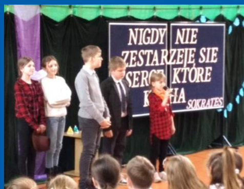
Dzień Babci i Dziadka klasa 5