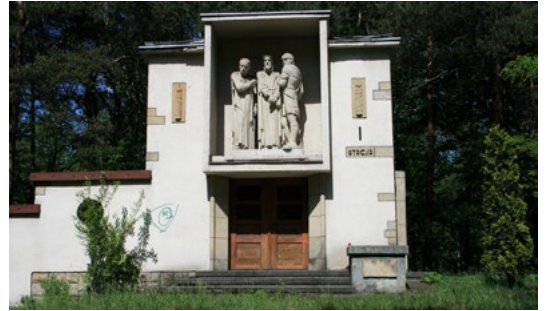
Kalwaria w Panewnikach