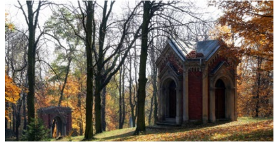
Kalwaria w Piekarach Śląskich