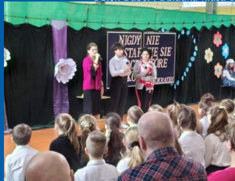
Dzień Babci i Dziadka klasa 8