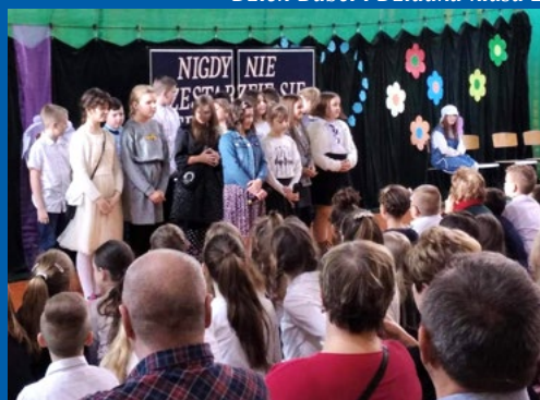
Dzień Babci i Dziadka klasa 4