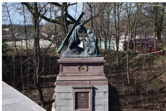
Droga Krzyżowa na Jasnej Górze

Wśród nowszych plenerowych Dróg Krzyżowych warto wymienić tę w Czernej koło Krakowa, gdzie w latach 1986-1990 dla uczczenia 350-lecia fundacji klasztoru karmelitańskiego na wzgórzu pnącym się ponad Karmelem powstał znakomicie wtopiony w zalesiony jurajski pejzaż szlak z wykutymi w białym kamieniu stacjami. Zupełnie inaczej wygląda Droga Krzyżowa nad miejscowością Kąty w Beskidzie Niskim, na stoku Góry Grzywackiej zwieńczonej krzyżem milenijnym z platformą widokową. Ascetyczne stacje, zkomponowane z metalowego grubego drutu, współgrają z trudem pielgrzyma podążającego stromym zboczem. Na tych szlakach nigdy nie brakuje wiernych rozważających Mękę Pańską w Wielkim Poście.