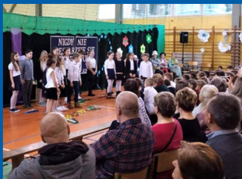
Dzień Babci i Dziadka klasa 3