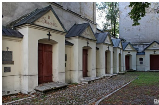
Stacje – kaplice drogi krzyżowej w Krakowie