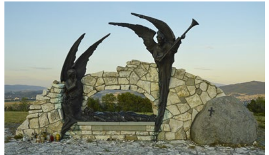
Matyska – Gulgota Beskidów