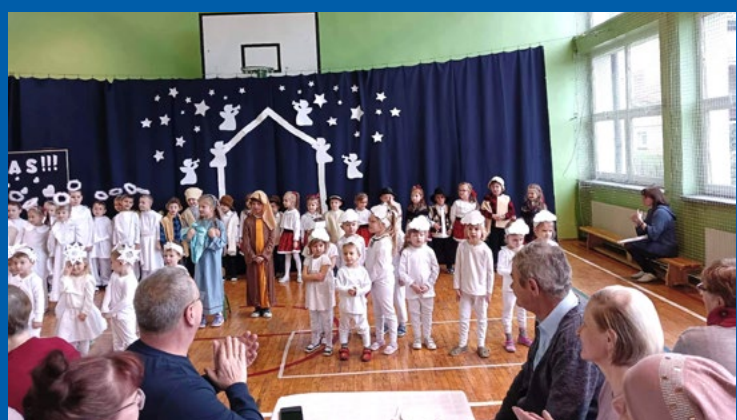
Dzień Babci i Dziadka w przedszkolu