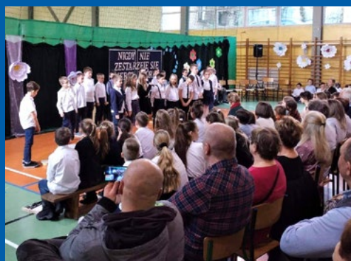
Dzień Babci i Dziadka klasa 2